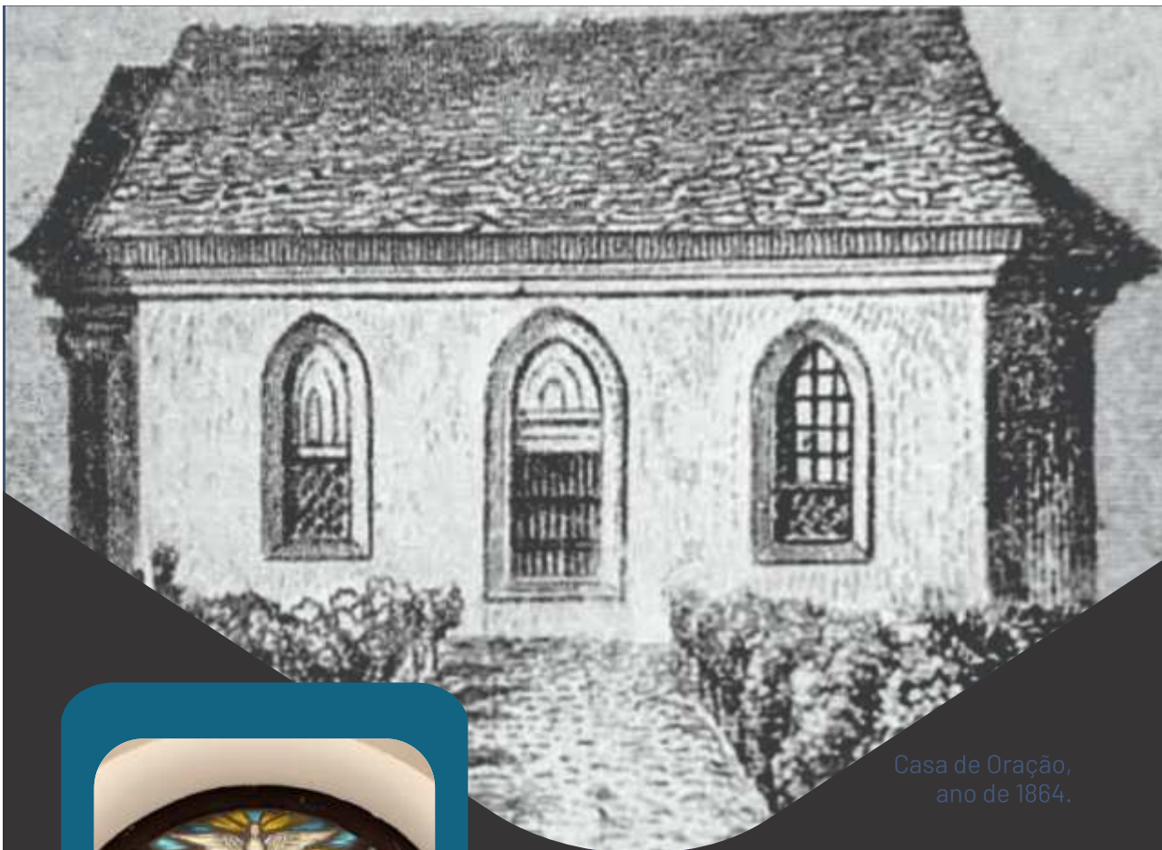
Casa de Oração, ano de 1864.